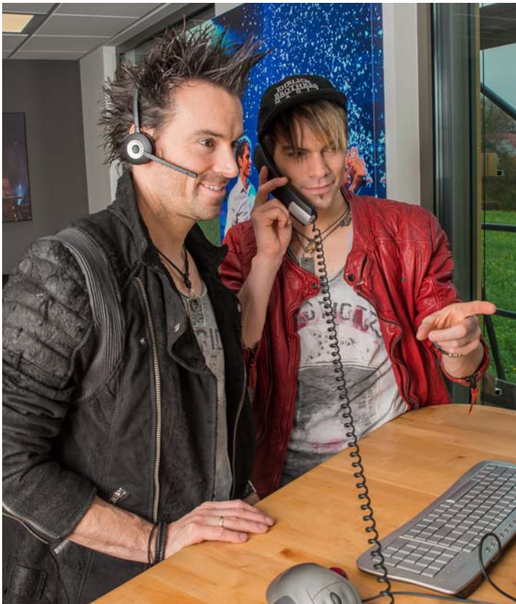
Ideen entstehen oft auch einfach am Telefon

mehreren schnurlosen Geräten sowie Headsets für alle Büromitarbeiter.