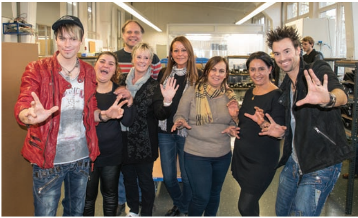
Die Ehrlich Brothers bei AGFEO - während der Werksführung war auch Zeit für Erinnerungsfotos