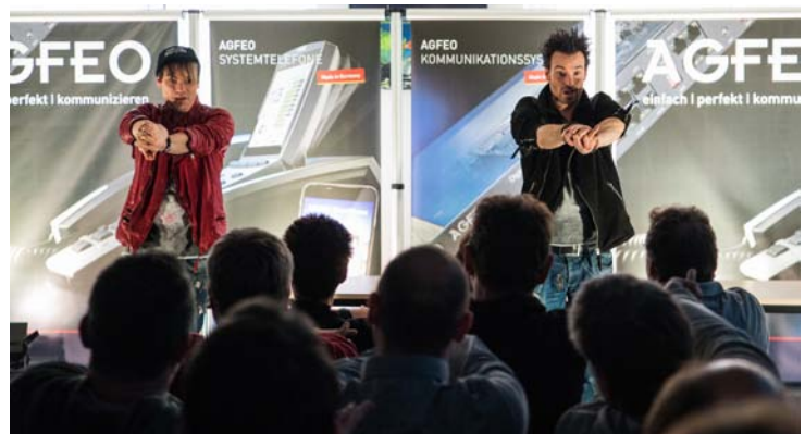
Die Ehrlich Brothers verzaubern die AGFEO-Mitarbeiter mit einer Mini-Show in der Werkskantine